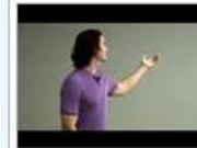
Innovation at Google Kanal: YouTube Dağıtımçı: google Etiketler: Innovation, Google, Douglas, Merrill 34K hit, 2007-8-2, 51d:47s