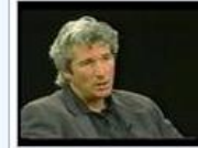
Charlie Rose - Richard Gere Kanal: YouTube Kategori: Haberler Dağıtımçı: CharlieRose Etiketler: charlie_rose, tvshow, 19K hit, 2007-8-25, 55d:16s